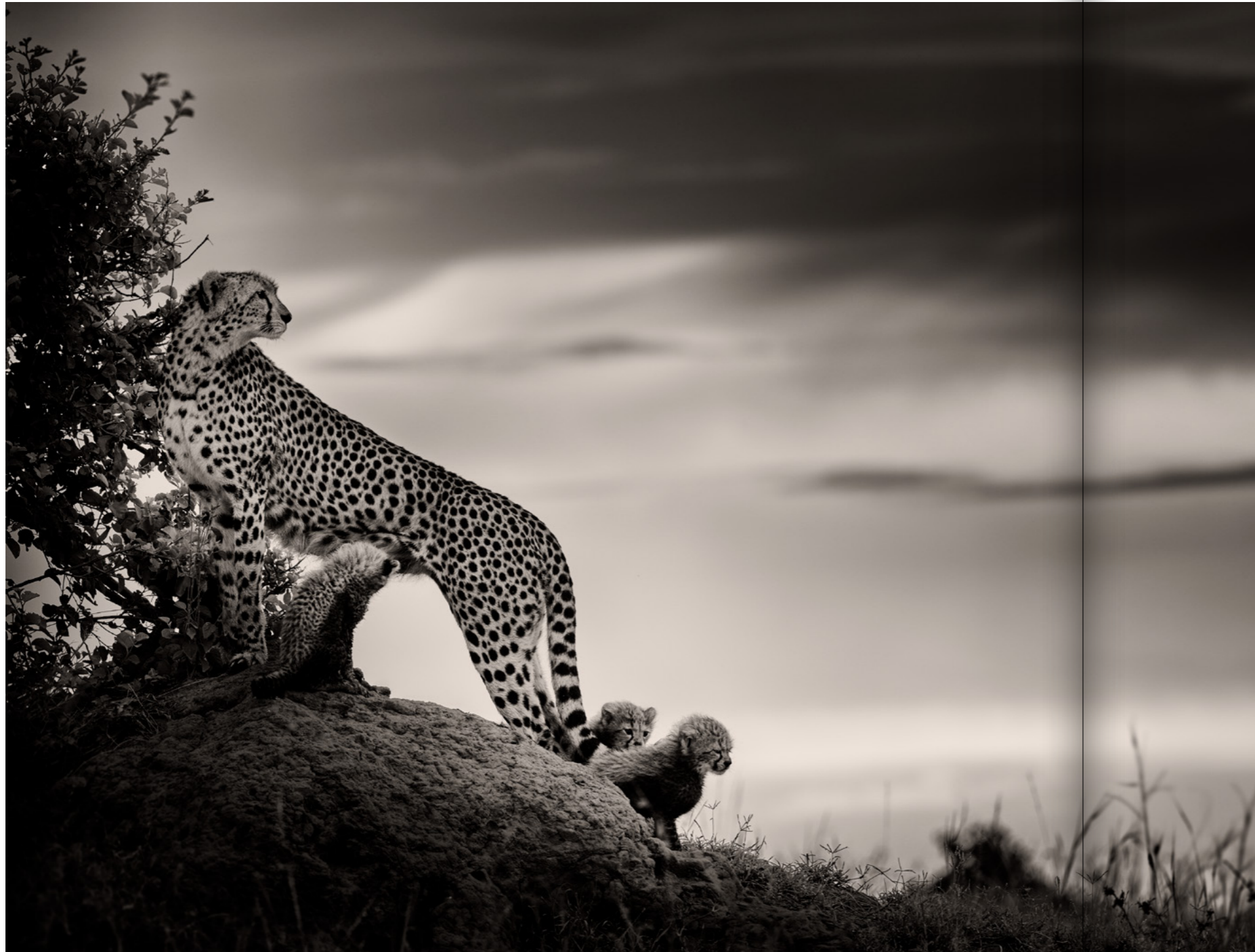
Μια οικογένεια γατόπαρδων στην Κένυα. Τα μικρά βρίσκονται μαζί με τη μητέρα τους, προκειμένου να μάθουν από νωρίς την τέχνη του κυνηγιού και της επιβίωσης.

Προκειμένου να πλησιάσει τα σπάνια ζώα της αφρικανικής σαβάνας, τα πλάνα που κατέστρωσε ποτέ δεν εξελίχθηκαν όπως θα ήθελε. Η ιδέα της απεικόνισής τους όμως παρέμεινε σταθερή. Απλώς έπρεπε να βρει το κατάλληλο κλειδί. Το βρήκε χάρη στον Τιμ, έναν αφρικανικό ελέφαντα ύψους τεσσάρων μέτρων στο Εθνικό Πάρκο του Αμποσέλι, που είχε το παρατσούκλι «Ευγενικός γίγαντας». «Ήμουν στο μονοπάτι του με τον οδηγό μου, όταν ξαφνικά [σ.σ.: ο ελέφαντας] άλλαξε πορεία και ερχόταν προς τα εμάς. Ήταν μακριά, περίμενα πως θα κάνει κάποιον ελιγμό. Δεν μπορείς να περιγράψεις ακριβώς το συναίσθημα όταν ένας ελέφαντας με τους χαυλιόδοντές του έρχεται καταπάνω σου. Ξάπλωσα μπροστά στο αμάξι, για να τον τραβήξω από χαμηλή οπτική γωνία. Έστριψε δεξιά μόνο όταν με πλησίασε στα τρία μέτρα», λέει στο «Κ».