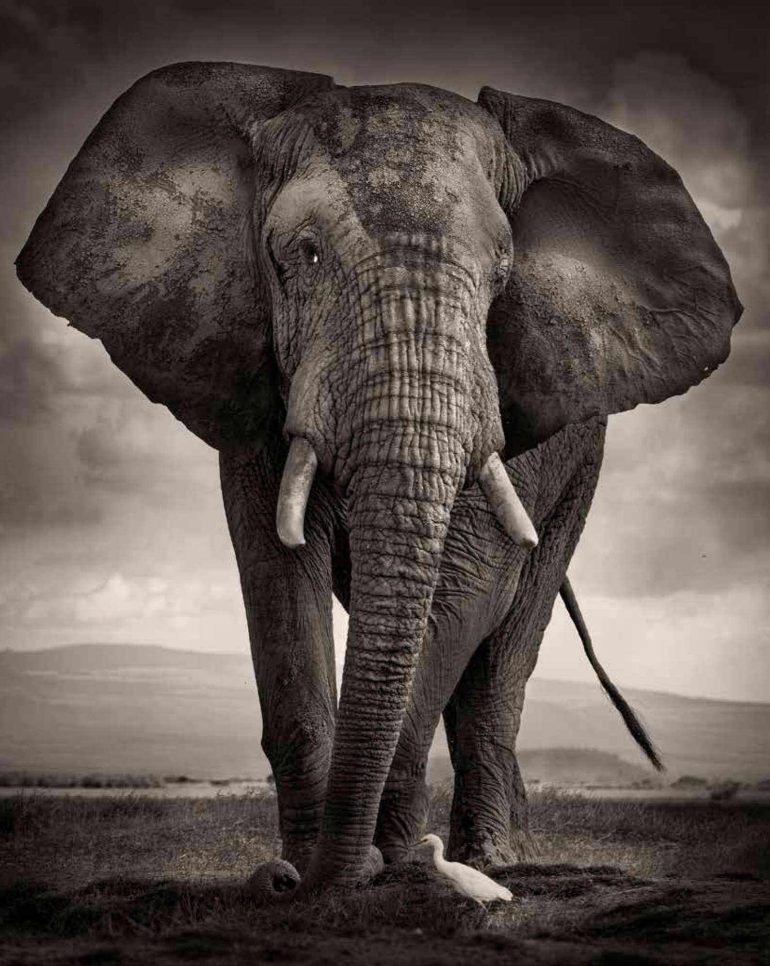
oben: Der Vogel hat keine Scheu vor dem riesigen Elefantenbullen – Groß und Klein in Harmonie. rechts: Der aufziehende Sturm versetzt die Elefantenherde in große Unruhe.