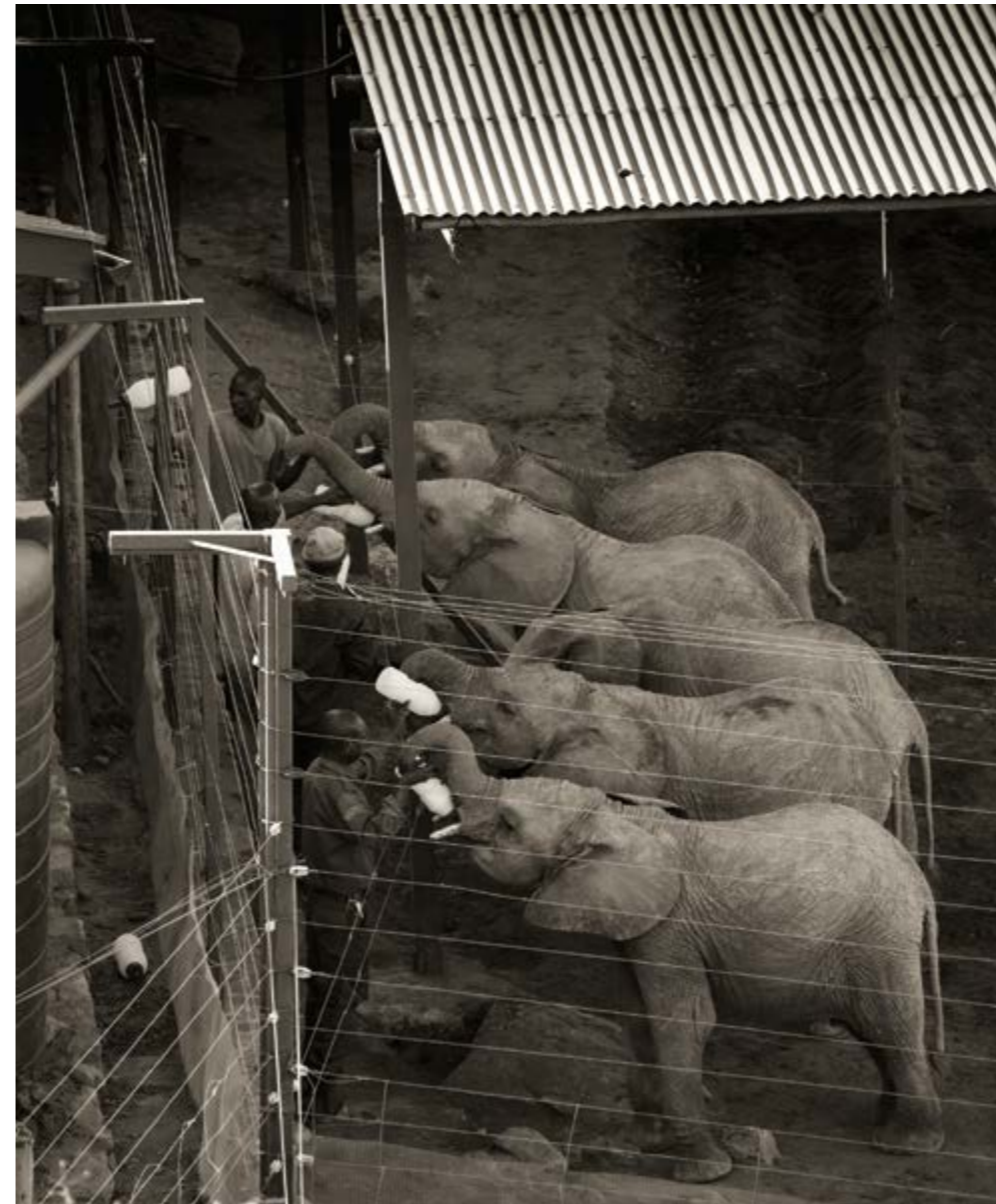
Aufzuchtstation des David Sheldrick Wildlife Trusts in Nairobi. Für jedes Tier gibt es eine eigene Flasche mit einem speziell entwickelten Muttermilchersatz.