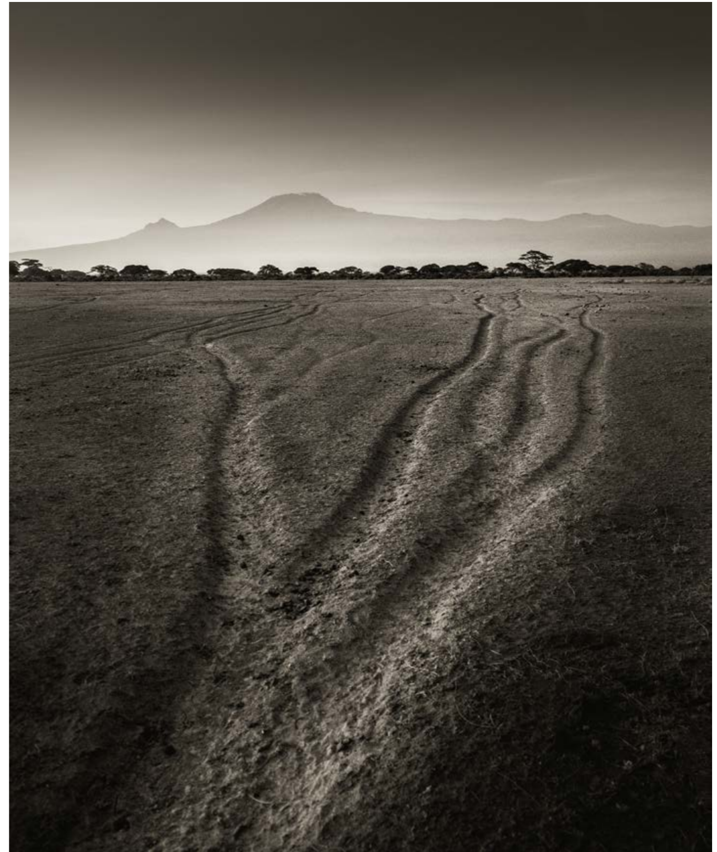
Elefantenpfade werden oft über Generationen hinweg benutzt. Dieser befindet sich im Amboseli Nationalpark.